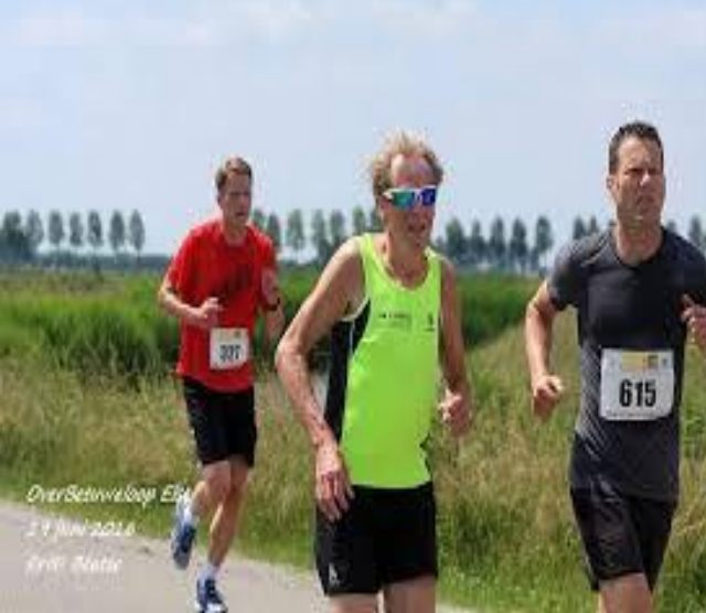
OverSetuuloop Elst 27 Juni 2016